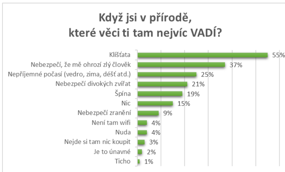
Graf č. 2: Odpovědi mladých na otázku: Když jsi v přírodě, které věci se ti tam nelíbí?